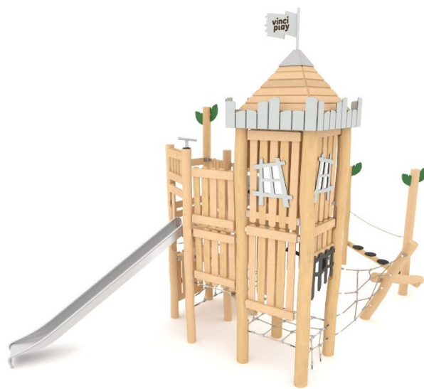
Área de Seguridad Mínima